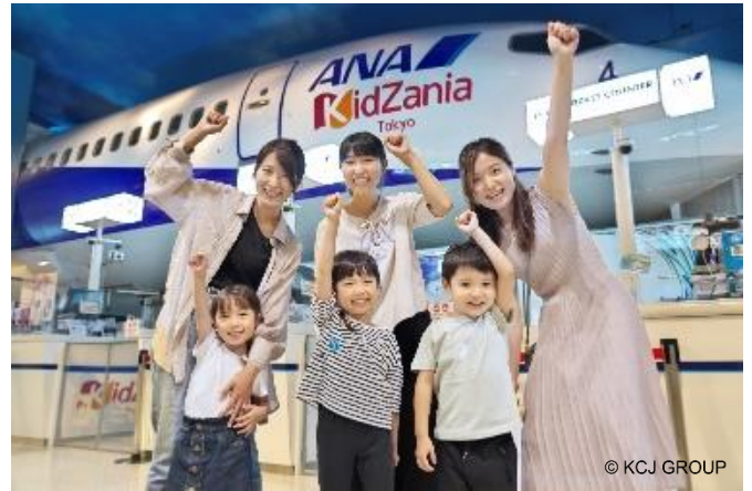
參考照片：位於日本國內的KidZania設施內之體驗畫面

「KidZania」開業日期預定將會在台北的「Mitsui Shopping Park LaLaport 南港(暫)」開業之後，預定2025年底。