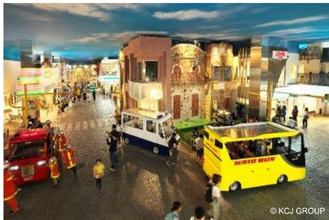
參考照片：位於日本國內的KidZania設施內之實景畫面